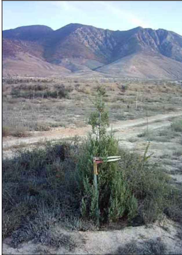
شکل ۲. نهال ارس Juniperus excelsa Bieb. در سطح ایستگاه تحقیقات آبخوان داری پشتکوه

نتایج تحقیق روی ارسستان‌های ایران نشان داده است اعمال قرق در رویشگاه‌های جزیره کبودان، چهارطاق اردل و لاین خراسان، افزایش زادآوری طبیعی این گونه را موجب شده است (۱۸). لازم به توضیح است زیستگاه گونه ارس در مناطق باز و مراتع کوهستانی قرار دارد. این گونه دامنه تحمل وسیعی از شرایط اکولوژیکی رویشگاه‌ها را داراست. بذر یا میوه‌های ارس توسط پرندگان کوهستان زی مانند کبک دری، کبک معمولی، تیهو و باقرقره به شدت مورد تغذیه قرار می‌گیرند و از مهم‌ترین عوامل حیاتی پراکنش این درختان نیز محسوب می‌شوند (۱۱). در ارتباط با ایستگاه تحقیقات آبخوان داری پشتکوه نیز به دلیل احداث کانال‌های آبرسان، نهرهای گسترشی و دروازه‌های عبور سیلاب جذب انواع گونه‌های پرندگان را در سطح عرصه آبخوان داری فراهم آورده است که از این جهت بر تکثیر طبیعی ارس تأثیری مثبت خواهد داشت. وجود