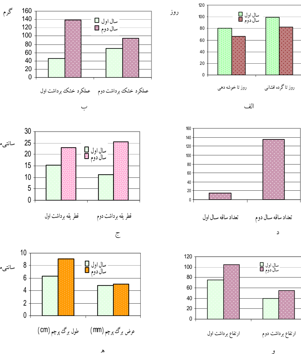
شکل ۱. مقایسه میانگین سال‌ها برای صفات مختلف در جمعیت‌های فسکیوی بلند (تفاوت بین سال اول و دوم برای تمام صفات در سطح ۵ درصد معنی‌دار است).

خشک بیشتری در برداشت اول و نیز در برداشت دوم در مقایسه با سال اول تولید نمودند (شکل ۱-ب). در سال اول عملکرد علوفه برداشت اول کمتر از برداشت دوم بود در حالی که این روند برای سال دوم معکوس بود که می‌تواند ناشی از استقرار نا کامل گیاهان در سال اول باشد. افزایش متوسط عملکرد سال دوم را می‌توان به توسعه سیستم ریشه‌ای این گونه