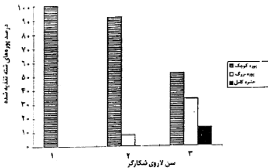
شکل ۲. ترکیب سنی شکار (شته سیاه باقلا) برای لاروهای شکارگر Leucopis glyphinivora Tanas.