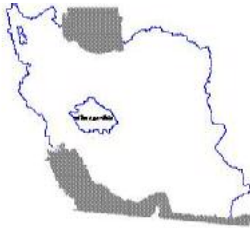
شکل ۱. منطقه مورد بررسی در ایران مرکزی