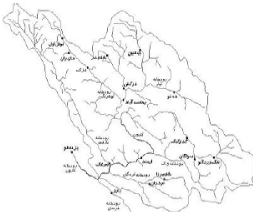
شکل ۳. ایستگاه‌های مورد بررسی در حوزه آبخیز کارون شمالی

منحنی، و توزیع‌های دارای چهار یا پنج پارامتر نظیر ویکبی به صورت ناحیه نشان داده شده است (۱۱). برابر با این نمودار، مناسب‌ترین توزیع برای ایستگاه‌های مورد بررسی به دست آمده است (جدول ۴).