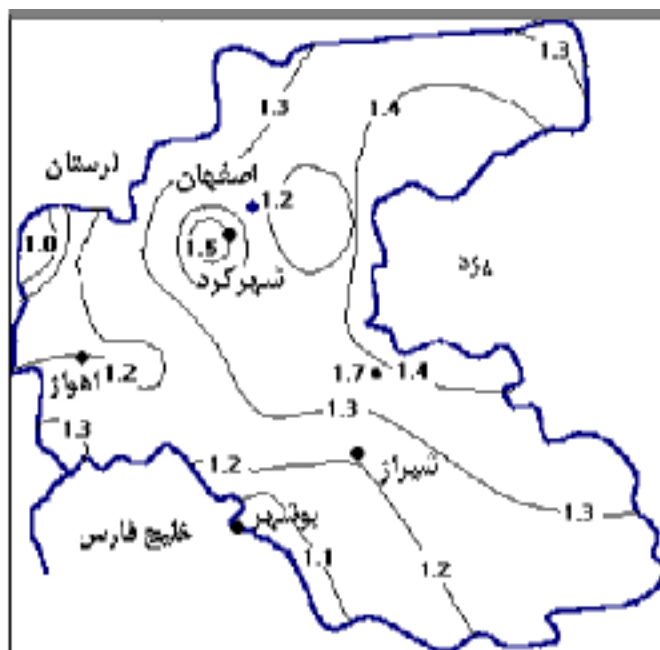
شکل ۳. توزیع جغرافیایی نسبت R_{EI}/R_b برای منطقه مورد بررسی

آبادیه در شمال شرقی شیراز)، که نشانه تأثیر شدیدتر این پدیده بر بارندگی این ایستگاه است. با این وجود، گرچه وقوع ال نینو در سال‌های ۱۳۵۶، ۱۳۷۰، ۱۳۷۱، ۱۳۷۳ و ۱۳۷۶ شمسی، برابر انتظار، افزایش شدید بارندگی در ایستگاه آبادیه را موجب شده،