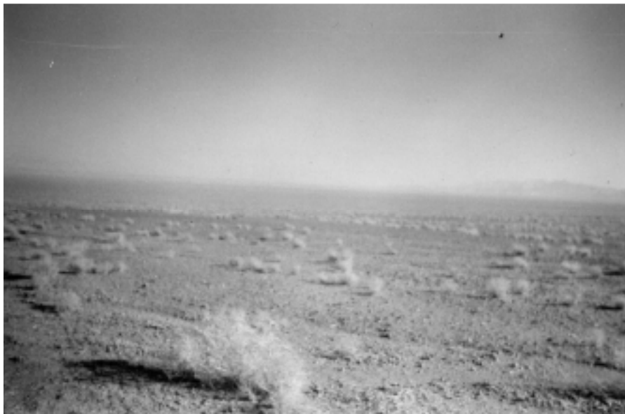
شکل ۲. منطقه فولاد میبد ندوشن یزد