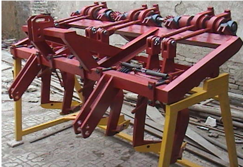
شکل ۱. چغندرکن ارتعاشی مورد آزمایش بدون واحد کنارزن برگ و ردیف کن (نمونه مشابه اونزین).

میله رابط با بازو ارتباط دارد (۴ در شکل ۲). دوران محور عرضی توسط این بشقاب‌های خارج از مرکز و میله‌های رابط به بازوها، که در نقطه اتصال به شاسی حالت لولایی دارند (۳ در شکل ۲)، منتقل شده و به آنها حرکت نوسانی می‌دهد.