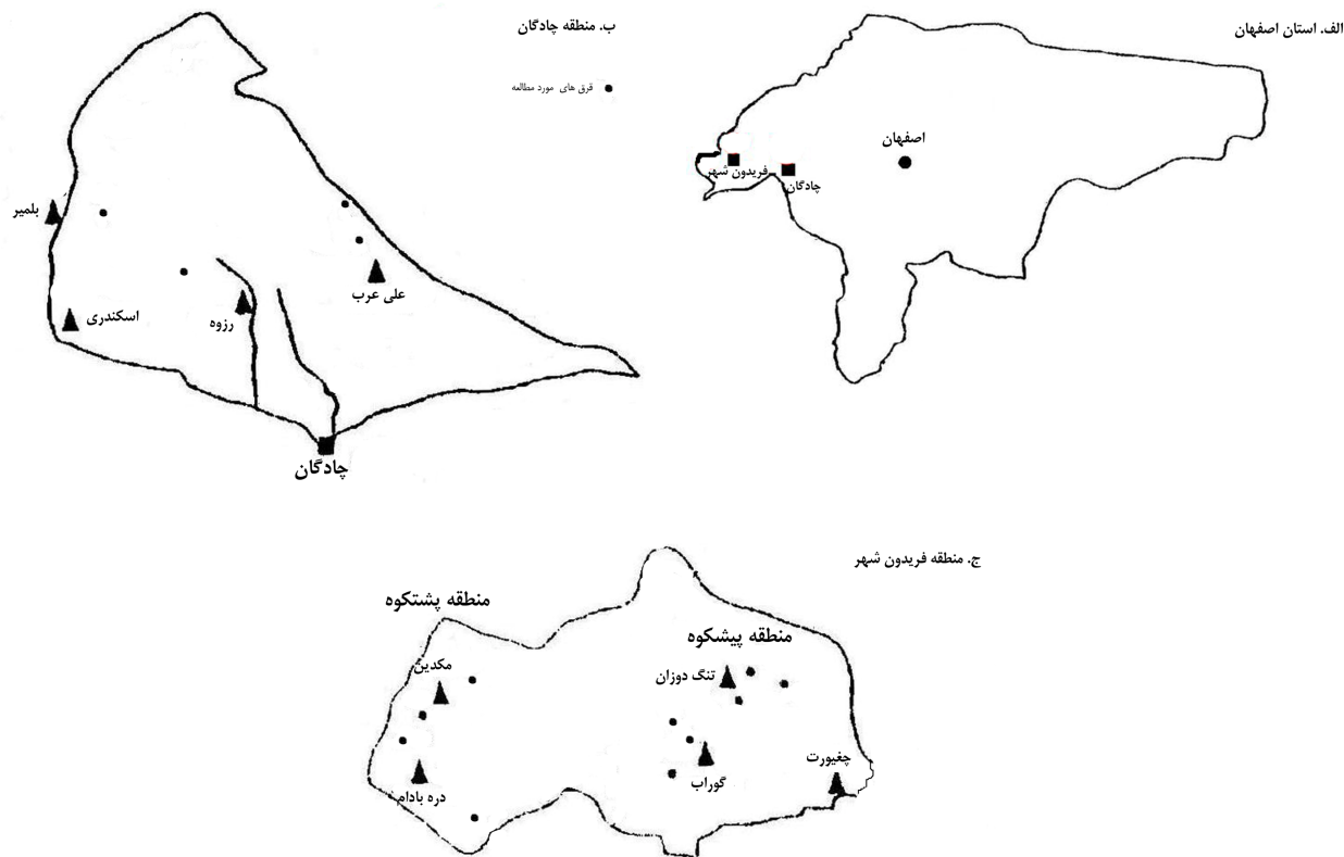
شکل ۱. موقعیت مناطق در استان اصفهان (الف) و محل فرق‌های نمونه برداری شده در شهرستان‌های چادگان (ب) و فریدون شهر (ج)

درصد گوسفند، ۲۰/۳ درصد بز و ۵ درصد گاو می‌باشد (۳). آمار رسمی نشان می‌دهد ۲۲/۸ درصد از جمعیت عشایری دارای پروانه بهره برداری از مرتع در دهستان پشتکوه قرار داشته و ۴۵/۸ درصد دام عشایری موجود در بخش فریدون شهر را دارا می‌باشند. شدت چرا در این منطقه ۰/۶۸ واحد دامی در هکتار می‌باشد. در صورتی که تنها ۱۷ درصد جمعیت عشایری و ۱۳ درصد دام عشایری موجود در بخش در منطقه پشتکوه چرا می‌نمایند و شدت چرا ۰/۳۸ واحد دامی در هکتار می‌باشد (۳). به نظر می‌رسد آمار واقعی بیش از این بوده و به طور کلی ۳۰ تا ۴۰ درصد دام موجود در این مناطق مازاد بر ظرفیت مراتع باشند (۳).