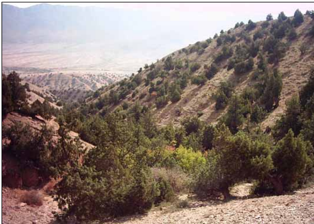
شکل ۳. درختان ارس Juniperus excelsa Bieb. در مناطق تخریب نیافته حوزه آبخیز پشتکوه

چرای مستقیم دام را نشان داده است (۲۴، ۲۸ و ۳۲). مطالعات انجام شده در کشور ما و به ویژه در گردنه چهارباغ نقش ارس‌های خزنده به خصوص Juniperus sabina را در امر حمایت از زاد آوری طبیعی نیز ثابت کرد به شکلی که در پناه یک بوته گسترده Juniperus sabina بیش از ۳۰ پایه درختی از گونه‌های مختلف شمارش شده است (۱۷). لازم به ذکر است گونه ارس Juniperus excelsa Bieb. در سطح حوزه پشتکوه و در طول سالیان دراز بخش‌هایی از دامنه‌های جنوبی و ارتفاعات پایینی دامنه‌های شمالی که دستخوش تخریب شدید اهالی منطقه بوده‌اند را به خود اختصاص داده است (شکل ۳). نهال‌های ارس نیز تنها گونه درختی می‌باشد که به صورت طبیعی در منطقه پشتکوه حضور دارد، از همین رو توجه بر تولید و تکثیر این گونه در عرصه آبخوانداری پشتکوه به همراه توسعه گونه‌های مرتعی در بین نهال‌های ارس (مرتع مشجر)، راهکاری متناسب با توسعه پایدار در سطح عرصه می‌باشد و این رویکرد با حداقل هزینه ضمن احیای جنگل‌های ارسستان حوزه پشتکوه، بیشترین تأثیر را بر روند توالی اکولوژیک