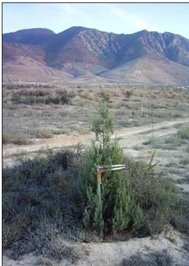
شکل ۲. نهال ارس Juniperus excelsa Bieb. در سطح ایستگاه تحقیقات آبخوان داری پشتکوه

نتایج تحقیق روی ارسستان‌های ایران نشان داده است اعمال قرق در رویشگاه‌های جزیره کبودان، چهارطاق اردل و لاین خراسان، افزایش زادآوری طبیعی این گونه را موجب شده است (۱۸). لازم به توضیح است زیستگاه گونه ارس در مناطق باز و مراتع کوهستانی قرار دارد. این گونه دامنه تحمل وسیعی از شرایط اکولوژیکی رویشگاه‌ها را داراست. بذر یا میوه‌های ارس توسط پرندگان کوهستان زی مانند کبک دری، کبک معمولی، تیهو و باقرقره به شدت مورد تغذیه قرار می‌گیرند و از مهم‌ترین عوامل حیاتی پراکنش این درختان نیز محسوب می‌شوند (۱۱). در ارتباط با ایستگاه تحقیقات آبخوان داری پشتکوه نیز به دلیل احداث کانال‌های آبرسان، نهرهای گسترشی و دروازه‌های عبور سیلاب جذب انواع گونه‌های پرندگان را در سطح عرصه آبخوان داری فراهم آورده است که از این جهت بر تکثیر طبیعی ارس تأثیری مثبت خواهد داشت. وجود