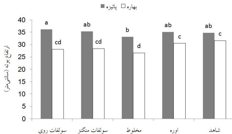
شکل ۲. اثر متقابل محلول پاشی با فصل کاشت بر ارتفاع بوته نخود در کشت‌های بهاره و پاییزه

ns و ** به ترتیب نشانگر معنی دار بودن در سطح احتمال ۵ و ۱ درصد و غیر معنی دار بودن است