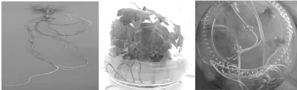
شکل ۲. شمایی از گیاهچه‌های C. pseudoheterophylla در تیمار ۶ (چهل دقیقه غوطه‌وری در هورمون IBA)

و به‌ندرت از شاخساره‌های نابجا هستند (۲۳). نقش و اثر BAP در شکستن غالبیت انتهایی و تحریک رشد شاخساره‌های جدید است، بنابراین با افزایش غلظت BAP در محیط، شاخه‌زایی بیشتری تولید می‌شود (۱۴) که دلیلی بر نتایج پژوهش حاضر است. در پژوهش حاضر در محیط کشت MS، ترکیب BAP به همراه NAA، سطح متعادل هورمونی را برای تکثیر سریع شاخه‌ها زلالک در کشت ایجاد کرد. علت این رخداد، می‌تواند ترکیبات فلاونوئیدی در محیط کشت حاوی BAP باشد. زیرا این هورمون فعالیت آنزیم‌های پرکسیداز را که موجب تجزیه ترکیبات فلاونوئیدی می‌شود، تشدید می‌کند (۹) و از طرفی با افزایش تولید سایتوکینین داخلی، در افزایش شاخه‌زایی مؤثر است (۶).