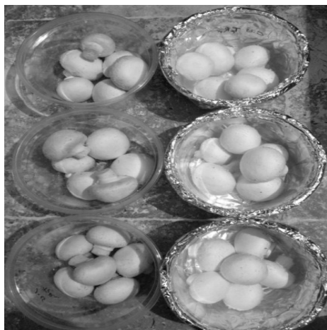
شکل ۱. نحوه بسته بندی قارچ ها

شدت وجود لکه های قهوه ای از طریق دیداری و با پنج درجه (بدون لکه، دارای لکه کم، متوسط، زیاد و شدید) تعیین شد (۴۰).