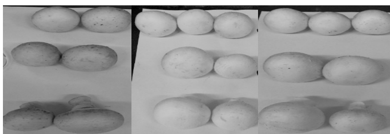
شکل ۳. تغییر رنگ قارچ‌های نگهداری شده در دمای یخچال و در ظرف پوشیده شده با فویل (به‌ترتیب از راست به چپ در روز سوم، هفتم و بیست‌وپنجم)