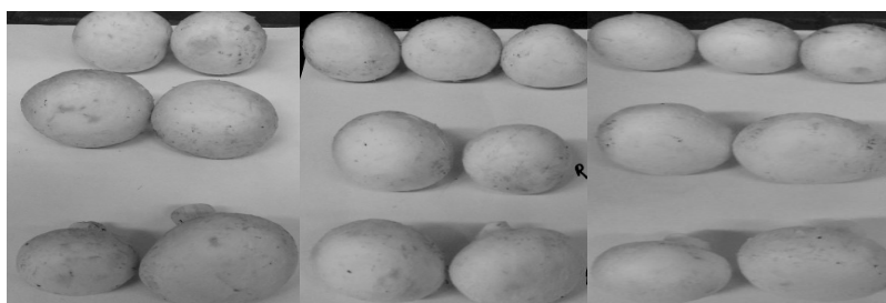
شکل ۲. تغییر رنگ قارچ‌های نگهداری شده در دمای یخچال و در ظرف شفاف (به‌ترتیب از راست به چپ در روز سوم، هفتم و بیست‌وپنجم)

حروف متفاوت در هر ستون، نشان‌دهنده وجود اختلاف معنی‌دار به‌ترتیب در سطح احتمال ۵ درصد و ۱ درصد براساس آزمون توکی می‌باشد.