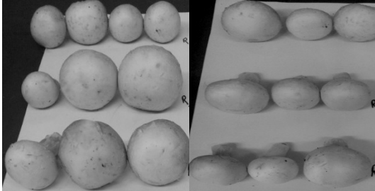
شکل ۴. تغییر رنگ قارچ‌های نگهداری شده در دمای محیط و در ظرف شفاف. (به ترتیب از راست به چپ در روز سوم و هفتم)