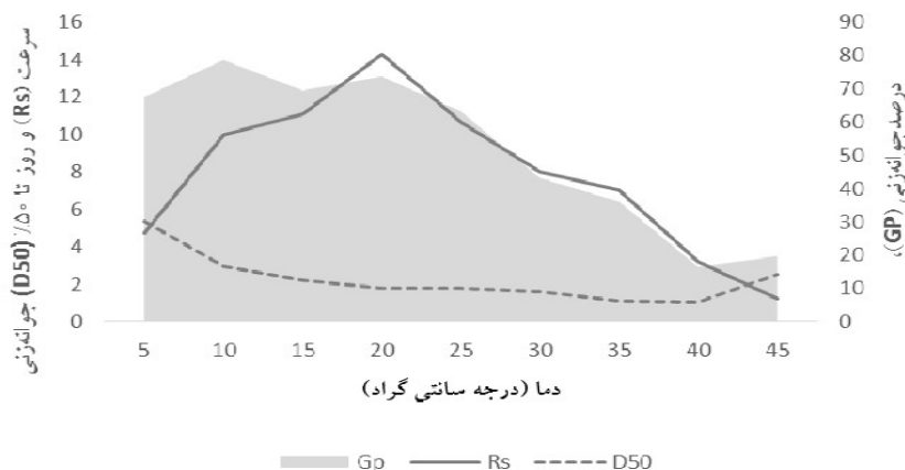
شکل ۲. تغییرات میانگین درصد جوانه‌زنی (GP)، سرعت جوانه‌زنی (Rs) برحسب تعداد بذر جوانه‌زده در روز و زمان لازم برای رسیدن به ۵۰ درصد جوانه‌زنی (D50) در درجه حرارت‌های مختلف بر روی گیاه گلرنگ (میانگین همه گونه‌های مورد بررسی برای اثر اصلی دما)