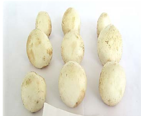
(پراکسید هیدروژن ۱ درصد)