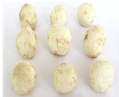
(آسکوربیک اسید ۲ میلی‌مولار)