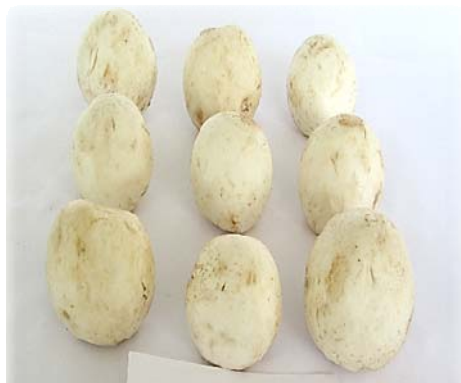
(کلرید کلسیم ۰/۴۵ درصد)