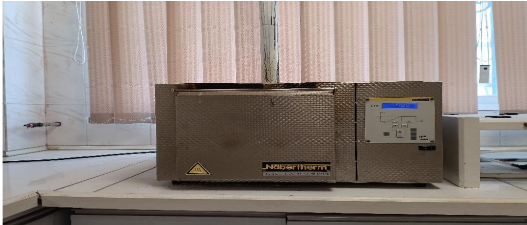
شکل ۲. کوره الکتریکی

لجن فاضلاب، کمپوست لجن فاضلاب و بایوچار آن‌ها بعد از خرد و عبور از الک ۱۰ مش یا ۲ میلی‌متر برای هر تیمار قبل از نشاء، با خاک گلدان‌ها مخلوط شدند (نیم درصد و یک درصد وزن خاک گلدان به ترتیب ۴۰ و ۸۰ گرم). پس از اعمال تیمارها در هر گلدان ۲ عدد نشای کاهو (در اواسط فصل زمستان) کشت شد. مراحل داشت شامل آبیاری، وجین و مبارزه با آفات طبق روش‌های معمول در منطقه صورت گرفت. در طی دوره رشد گیاهان در گلخانه، عملیات آبیاری با آب چاه و وجین علف‌های هرز با دست انجام شد.