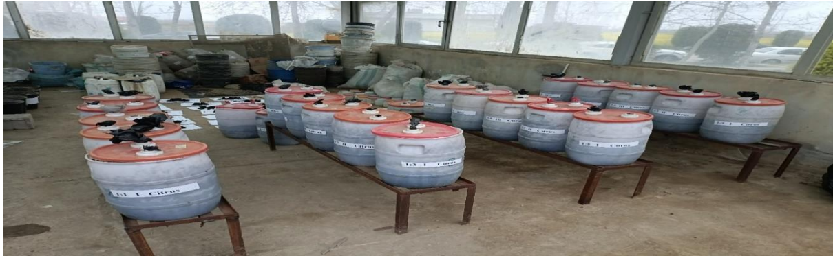
شکل ۱. کمپوست های لجن فاضلاب اصلاح شده با کاه برنج و سرشاخه مرکبات

برنج (نسبت ۴ به ۱ لجن فاضلاب و کاه و کلش برنج) و کمپوست لجن فاضلاب اصلاح شده با سرشاخه مرکبات (نسبت ۴ به ۱ لجن فاضلاب و سرشاخه مرکبات) تولید شدند. تولید کمپوست‌ها در بشکه‌هایی در داخل گلخانه صورت گرفت بدین شکل که مرتباً به آن آب اضافه شده و همچنین به‌طور منظم محتویات بشکه‌ها به‌خوبی هم‌زده شد تا شرایط تهیه کمپوست فراهم گشته و بعد از چند ماه کمپوست‌ها آماده شدند (شکل ۱).