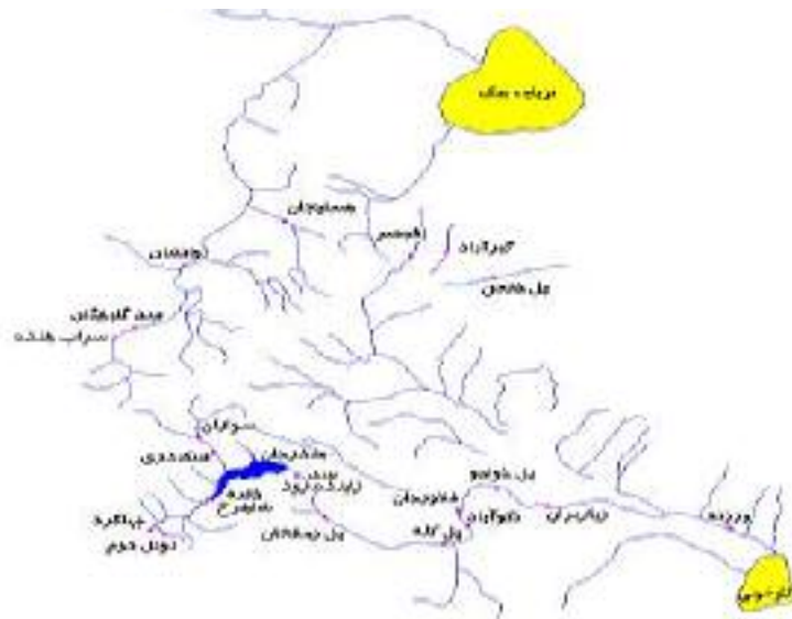
شکل ۲. ایستگاه‌های مورد بررسی در حوزه‌های آبخیز زاینده‌رود و قم

حوزه آبخیز سد زاینده‌رود، از شمال غرب به حوزه رودخانه دز، از جنوب به حوزه آبخیز رودخانه خرسان و از جنوب و غرب به بخش‌هایی از حوزه آبخیز کارون بزرگ محدود می‌گردد (شکل ۳).