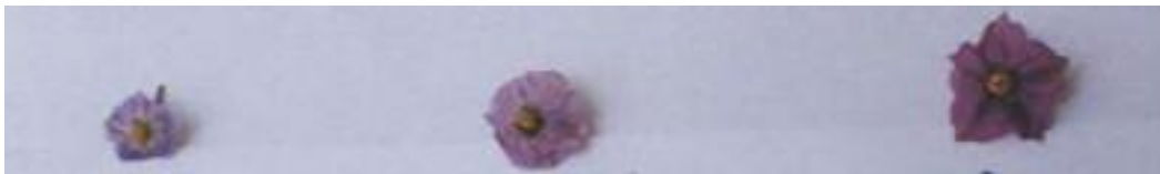
شکل ۲. شکل گل‌ها در والدین و هیبرید به ترتیب از راست به چپ: فورا، هیبرید فورا \times آکول و آکول