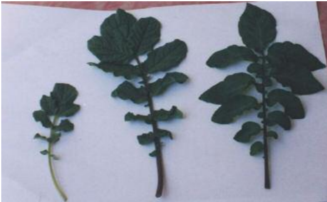
شکل ۱. شکل برگ‌ها در والدین و هیبرید به ترتیب از راست به چپ: فورا، هیبرید فورا \times آکول و آکول