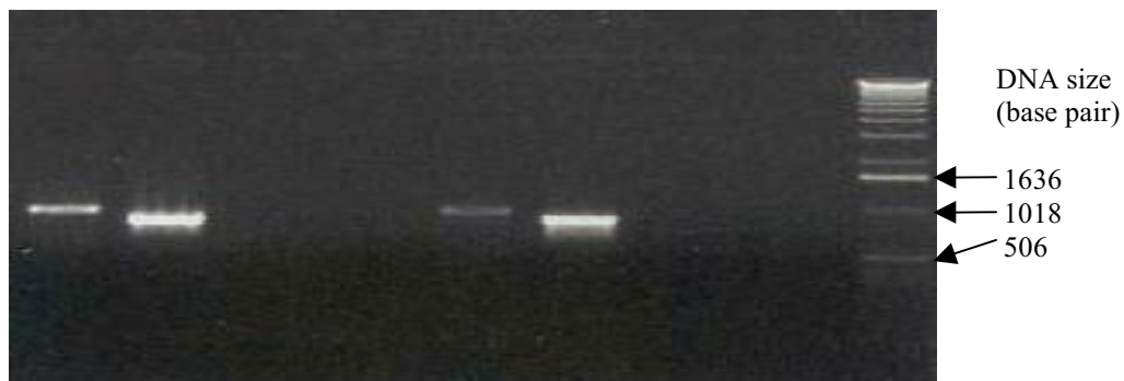
شکل ۳. نتایج PCR دو نمونه پلاسمید نوترکیب pAM-FLVAP با به اختصار pAMVAP با آغازگرهای مختلف برای تأیید همسو بودن