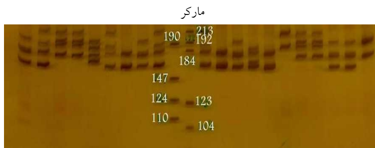
شکل ۱. الگوی باندها برای جایگاه MCMA2