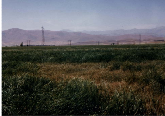
شکل ۱. مزرعه گندم مبتلا به پوسیدگی ریشه و طوقه در اثر شبه جنس Bipolaris