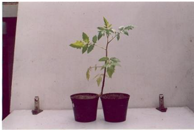
شکل ۱. تقسیم ریشه گیاه در دو گلدان مجاور برای مطالعه تأثیر سیستمیک نماتود مولد گره ریشه Meloidogyne javanica بر میزان بیماری و فعالیت آنزیم فنیل آلانین آمونیا لیاز در تعامل با قارچ عامل بیماری پژمردگی فوزاریومی گوجه فرنگی Fusarium. oxysporum fsp lycopersici

واريته Roma VF و مدت زمان لازم برای رسیدن به ظهور بالغ‌های جوان به ترتیب دو روز و ۱۵ روز بر اساس صاحبانی در نظر گرفته شد (۱).