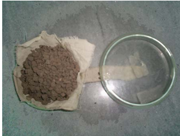
شکل ۱. پل آبی برای انتقال آب به ظرف دارای خاکدانه‌ها

اندازه‌گیری مقاومت کششی خاکدانه‌ها (۹) در رطوبت هوا- خشک و مکش ماتریک 500 \text{ kPa} استفاده شد. آزمایش‌های اولیه نشان داد که به دلیل پایداری اندک خاک‌های مورد بررسی، مقاومت کششی خاکدانه‌ها در مکش‌های ماتریک کمتر از 500 \text{ kPa} ناچیز بوده و تغییر شکل آنها عمدتاً خمیری و ماندگار می‌باشد که با اصول روش غیرمستقیم برزیلی مغایرت دارد. خاکدانه‌های با اندازه 3-8 \text{ mm} به روش الک خشک جدا شده و ۳۰ عدد از آنها به‌طور تصادفی برای هر آزمایش انتخاب و وزن شدند. برای تیمار مکش ماتریک 500 \text{ kPa} ، ۳۰ عدد از خاکدانه‌های مذکور انتخاب شده و مکش ماتریک آنها با استفاده از پل آبی (شکل ۱) به 500 \text{ kPa} رسانده شد. خاکدانه‌ها بین دو صفحه بارگذاری (با استفاده از دستگاه تک محوری (Uniaxial compression test)) شکسته شده و مقاومت کششی آنها به کمک رابطه زیر محاسبه شد: