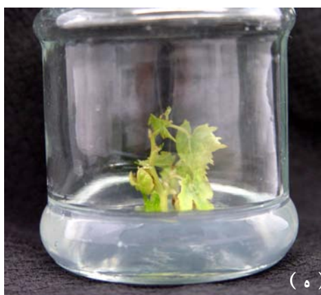
تصویر ۱. مطالعه اثر تنظیم‌کننده‌های رشد و نمک بر رشد شاخه: الف - ریزنمونه جوانه زده با قطر مناسب ساقه. ب - نمونه‌ای از شاخه‌رویی در محیط نمک MS با تنظیم‌کننده رشد BI. ج - رشد شاخساره در یکی از آزمایش‌ها در نمک WPM دو هفته پس از کشت. د - پرآوری در یکی از آزمایش‌ها در نمک WPM به مدت ۴۹ روز پس از کشت. ه - نمونه‌ای از شاخساره بدست آمده در محیط SEM برای طولیل شدن ساقه و رشد ریشه. و - پس از رشد کافی ریشه، شاخساره به خاک منتقل شده است.