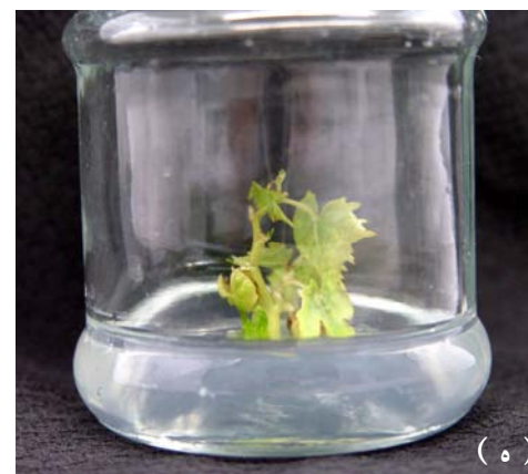
تصویر ۱. مطالعه اثر تنظیم‌کننده‌های رشد و نمک بر رشد شاخه: الف - ریزنمونه جوانه زده با قطر مناسب ساقه. ب - نمونه‌ای از شاخه‌رویی در محیط نمک MS با تنظیم‌کننده رشد BI. ج - رشد شاخساره در یکی از آزمایش‌ها در نمک WPM دو هفته پس از کشت. د - پرآوری در یکی از آزمایش‌ها در نمک WPM به مدت ۴۹ روز پس از کشت. ه - نمونه‌ای از شاخساره بدست آمده در محیط SEM برای طولیل شدن ساقه و رشد ریشه. و - پس از رشد کافی ریشه، شاخساره به خاک منتقل شده است.