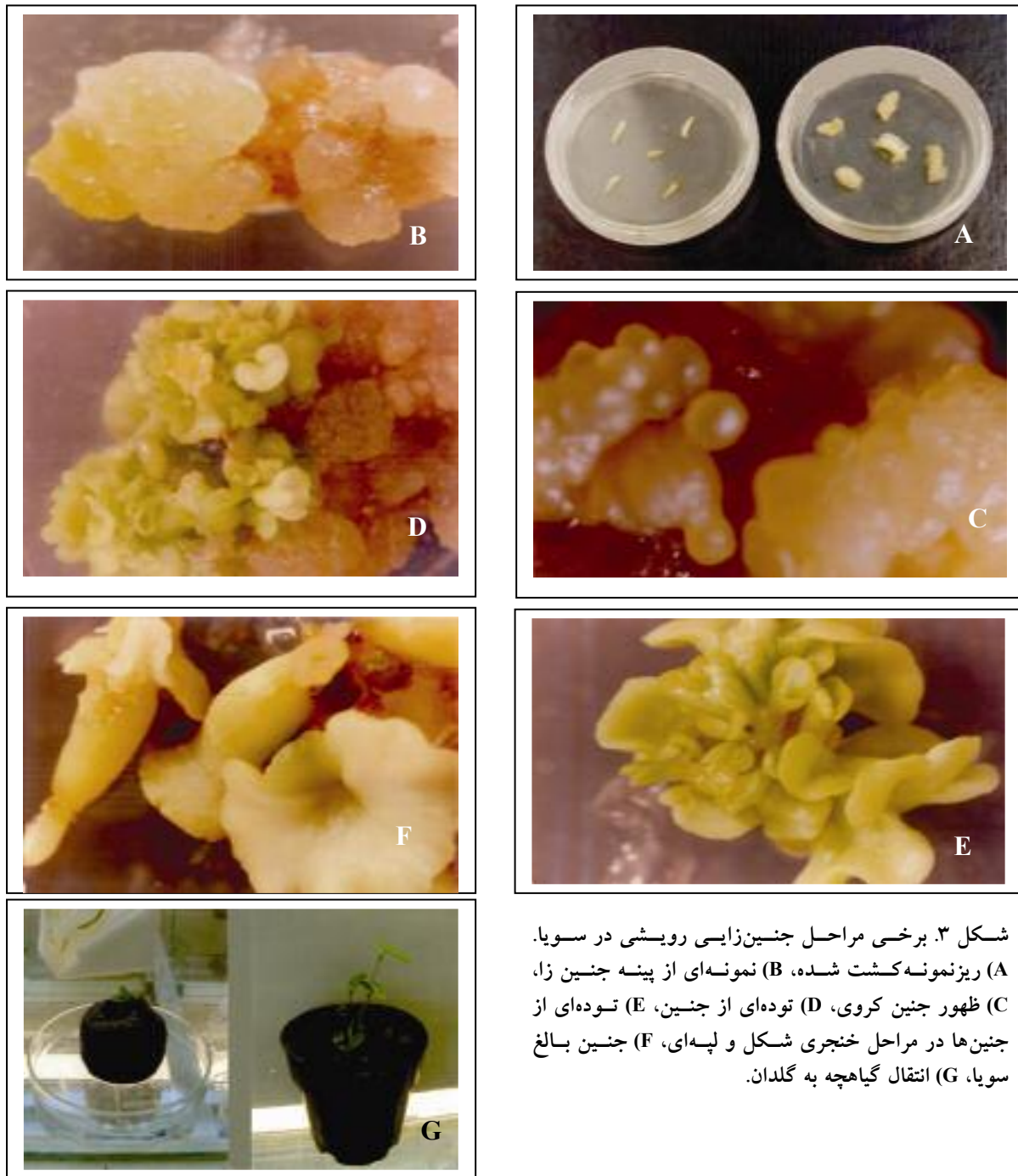
شکل ۳. برخی مراحل جنین‌زایی رویشی در سویا. (A) ریزنمونه کشت شده، (B) نمونه‌ای از پینه جنین‌زا، (C) ظهور جنین کروی، (D) توده‌ای از جنین، (E) توده‌ای از جنین‌ها در مراحل خنجری شکل و لپه‌ای، (F) جنین بالغ سویا، (G) انتقال گیاهچه به گلدان.