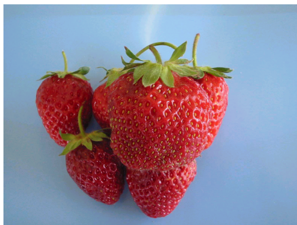
شکل ۱. نمونه‌های توت فرنگی قبل از اعمال تیمار

نتایج حاصل نشان می‌دهد که بین نمک‌های مختلف کلسیم نیز اختلاف معنی‌داری وجود دارد. نیترات کلسیم بالاترین و سولفات کلسیم کمترین اثر را در افزایش میزان کلسیم بافت دارا بودند. این نتیجه نیز با میزان حلالیت این نمک‌ها در محلول‌های مربوطه همخوانی دارد. اندازه‌گیری میزان کلسیم بافت در پایان روز پنجم و دهم نگهداری نمونه‌ها، نشان داد که میزان کلسیم نمونه‌ها با گذشت زمان به میزان اندکی افزایش میابد اما این افزایش معنی‌دار نبود. دسوزا، چانگ، چور و ویلموت و لیما (۷، ۸، ۱۰ و ۱۲) نیز اثرات مشابهی را در مورد رابطه بین میزان کلسیم بافت میوه‌ها و غلظت کلرید کلسیم مورد استفاده گزارش کردند.