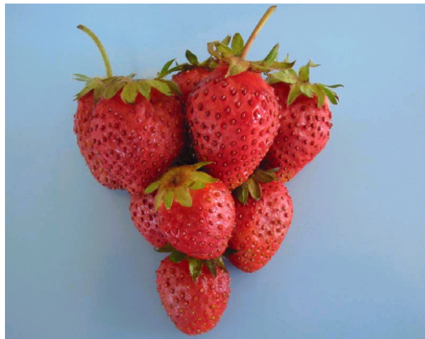
شکل ۲. نمونه‌های توت فرنگی ۲ ساعت پس از تیمار در محلول کلرید کلسیم

تازه‌خوری دارند توصیه نمود. ضمن آن که تلخی طعم حاصل از کاربرد املاح نیترات و تا حدی کلرید کلسیم نیز خود مزید بر علت است. به نظر می‌رسد روش محلول پاشی، قابلیت کاربرد در سطح تازه خوری این محصول را ندارد، اما استفاده از املاح سولفات و یا کلرید کلسیم (در غلظت‌های پایین) جهت آماده سازی نمونه قبل از اعمال فرایند انجماد برای نگه‌داری طولانی مدت و نیز برای توت فرنگی‌هایی که به مصرف تولید کنسانتره می‌رسند قابل بررسی است. چرا که به هر حال طی مرحله انجماد یا یخ‌زدایی توت فرنگی، حالت اولیه میوه تا حدی زایل می‌گردد و این امر حساسیت چندانی را ایجاد نمی‌کند ضمن آنکه کپک زدگی و لهیدگی محصول طی حمل و نقل کاهش می‌یابد. دسوزا، موریس و روزن (۱۰، ۱۵ و ۱۶) نیز توصیه مشابهی را برای محلول پاشی توت فرنگی با کلرید کلسیم به عمل آورده‌اند. به هر حال چنین به نظر می‌رسد که کماکان عملی‌ترین روش‌های کاهش ضایعات و افزایش عمر انبارداری محصول توت فرنگی برای مصارف تازه خوری، سرد کردن سریع محصول برداشت شده، جابه‌جایی و بسته‌بندی محصول در حجم‌های کوچک و ظروف کم عمق (حدود ۱۵ سانتی‌متر) و ذوزنقه‌ای شکل و استفاده از انبارهای سرد با دمای ۱- درجه سانتی‌گراد برای نگه‌داری کوتاه مدت محصول است.