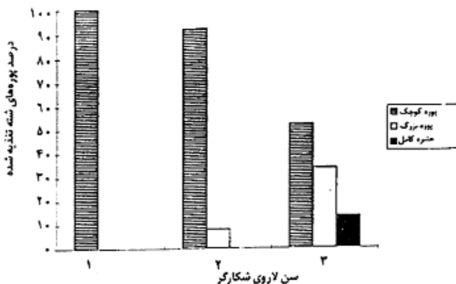
شکل ۲. ترکیب سنی شکار (شته سیاه باقلا) برای لاروهای شکارگر Leucopis glyphinivora Tanas.