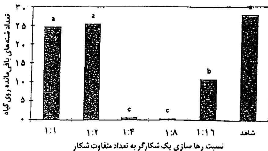
شکل ۳. شمار شته‌های باقی مانده روی گیاه باقلا پس از یازده روز (پایان دوره لاروی) و بعد از رها سازی شکارگر