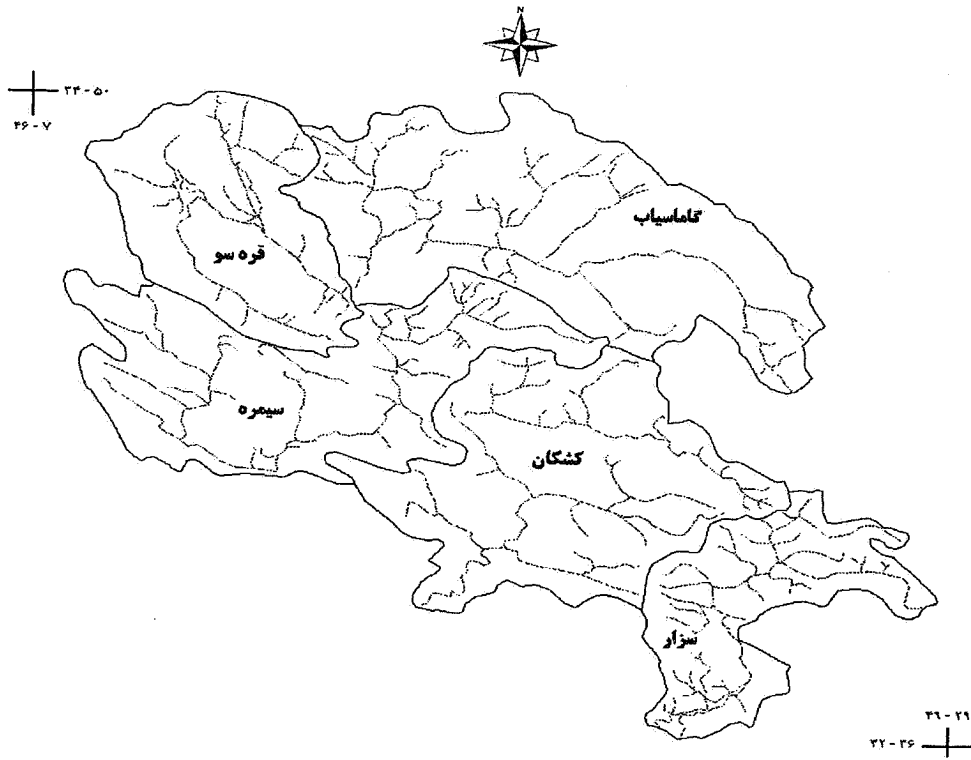
شکل ۱. حوزه‌های آبخیز مورد مطالعه