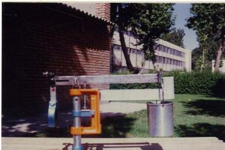
شکل ۱. دستگاه اندازه‌گیری مقاومت کششی