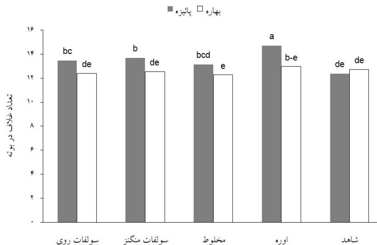
شکل ۳. اثر متقابل محلول پاشی با فصل کاشت بر تعداد غلاف در بوته نخود در کشت‌های بهاره و پائیزه

در هر ستون و برای هر تیمار میانگین‌های دارای حروف مشترک، در سطح احتمال ۵ درصد، اختلاف معنی‌داری ندارند.