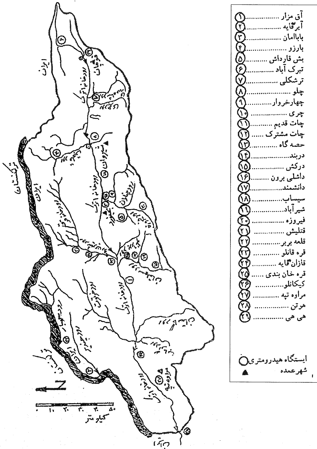
شکل ۲- موقعیت حوضه آبخیز اترک