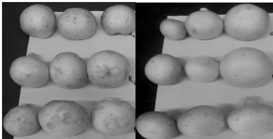
شکل ۵. تغییر رنگ قارچ‌های نگهداری شده در دمای محیط و در ظرف پوشیده شده با فویل. (به ترتیب از راست به چپ در روز سوم و هفتم)

معنی‌دار بود ولی اثر نوع ظرف معنی‌دار نبود. قارچ‌های پرورش یافته در کمپوست کلش برنج و تفاله زیتون بیشترین درصد ماده خشک در روز هفتم (به ترتیب ۹/۱۵٪ و ۱۱/۶۲٪) را در یخچال و اتاق نشان دادند که اختلاف معنی‌داری با قارچ‌های پرورش یافته در کمپوست شاهد در سطح احتمال یک درصد داشتند (جدول ۴). به‌علت از بین رفتن قارچ‌های نگهداری شده در دمای اتاق، در روز هفتم، لازم شد تجزیه جداگانه‌ای نیز برای نمونه‌های یخچال تا روز بیست‌وپنجم انجام شود که نتایج اندازه‌گیری‌ها در این مقاله نیامده است.