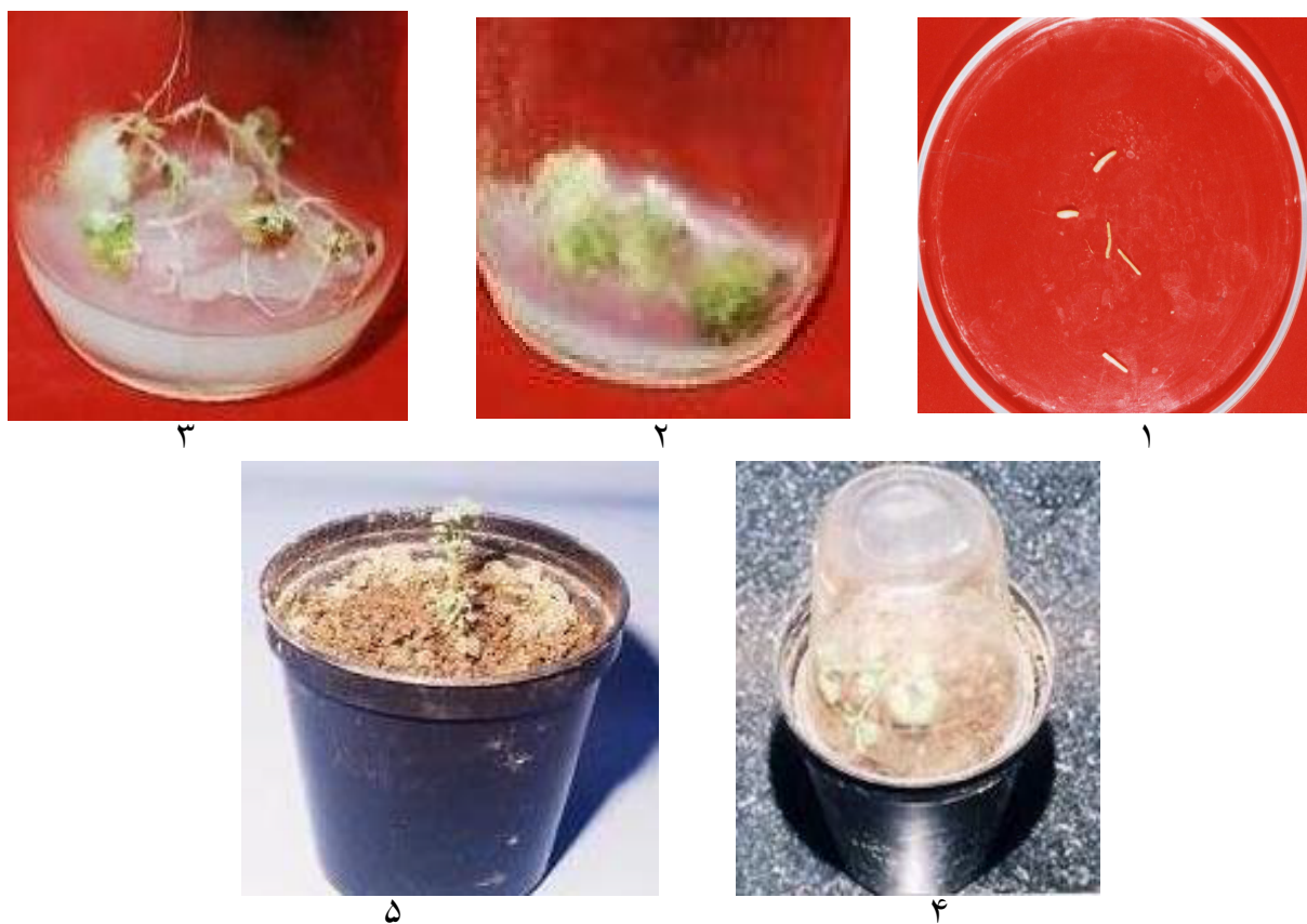
شکل ۴. مراحل مختلف باززایی گیاه یونجه از طریق ایجاد جین سوماتیک