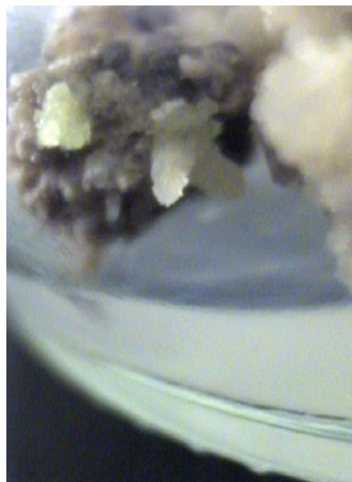
شکل ۳. ایجاد نوساقه در کالوس‌های یونجه در محیط کشت M12