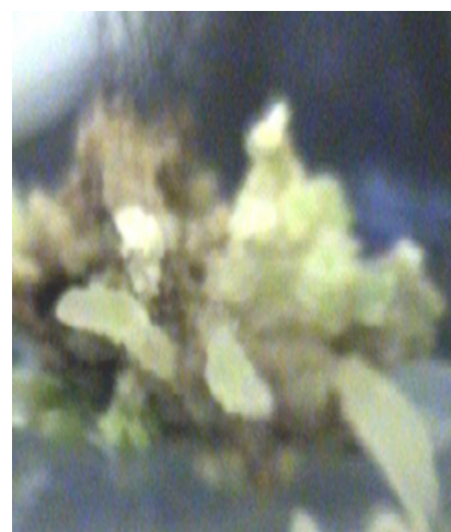
شکل ۱. ایجاد جنین سوماتیک در کالوس‌های یونجه در اکسین و اتینل استرادیول (محیط کشت M6)