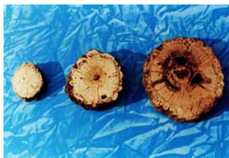
شکل ۳. نمونه‌هایی از مقاطع صیقل داده شده گون گزی که مقطع سمت راست حدوداً دارای سن ۷۰، مقطع وسطی حدود ۴۰ و مقطع سمت چپ حدود ۲۰ سال می‌باشد.

پوشش، سن گیاه و رطوبت محیط بررسی شود تا نقش آن مشخص گردد.