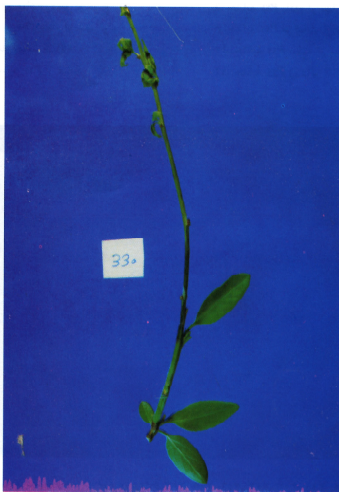
شکل ۲. ایجاد علائم شانکر در شاخه بادام در اثر مایه‌زنی با سوسپانسیون جدایه ۲۴ (بادام) Pseudomonas syringae pv. syringae