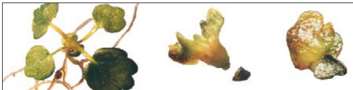
الف. رشد گیاهچه ۲ روز بعد از کشت ب. رشد گیاهچه ۴ روز بعد از کشت ج. رشد دانه‌های توت فرنگی ۷ روز بعد از کشت

تصویر ۲. مراحل جوانه‌زنی بذر نصف شده توت فرنگی حاوی گیاهچه در محیط کشت درون شیشه ( In vitro )