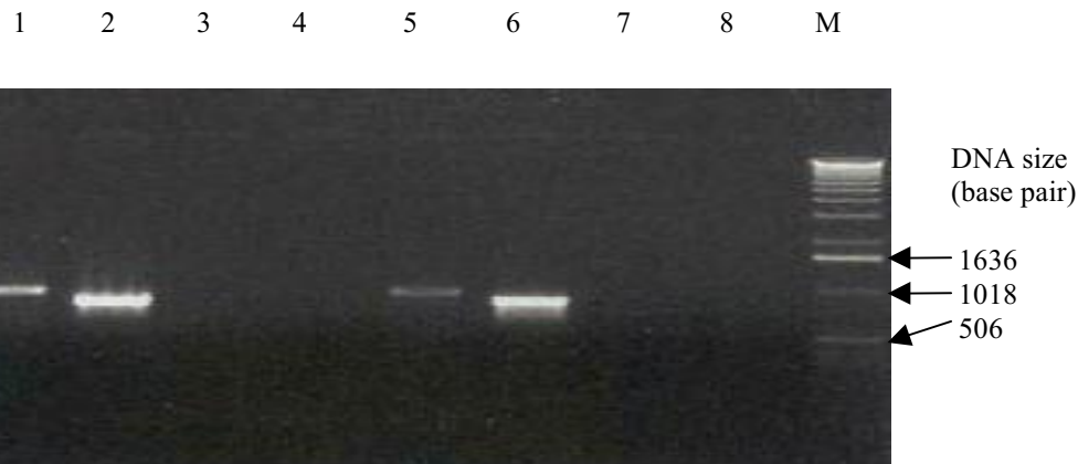
شکل ۳. نتایج PCR دو نمونه پلاسمید نوترکیب pAM-FLVAP با به اختصار pAMVAP با آغازگرهای مختلف برای تأیید همسو بودن