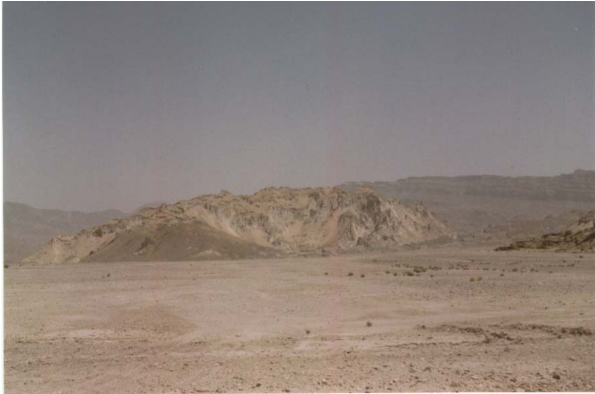
شکل ۱. سیمای طبیعی گنبد نمکی کرسیا در محدوده شهرستان داراب