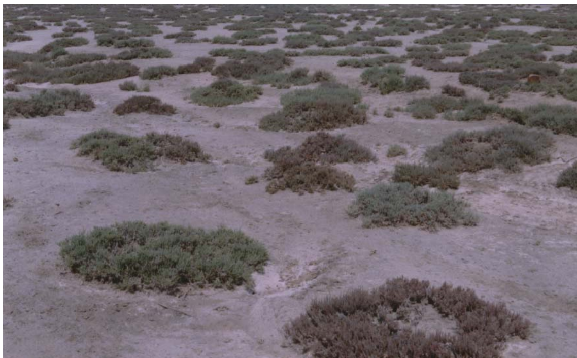
شکل ۳. سیمای تیپ گیاهی یک‌نواخت با غالبیت Halocnemum strobilaceum در منطقه دشت کرسیا

بیان کرد شورروی‌های گوشتی و آبدار مانند Halocnemum با مرگ آگاهانه قسمت‌هایی از بافت‌های گوشتی خود مقدار زیادی نمک را برای ادامه بقای از دست می‌دهند (۲۴). ایزمیل دریافت که میزان نمک محلول در اندام‌های مرده گیاه ۲۱/۵ درصد بود در حالی که میزان این املاح در قسمت‌های سرپا فقط ۵/۹ درصد بوده است (۲۶). باتانونی ضمن قرار دادن این گونه در گیاهان متحمل شوری، اشکال تطابقی آن با شرایط شوری را با تولید بافت‌های گوشتی، کاهش هدررفت آب از طریق چوب پنبه‌ای شدن اندام‌های مسن، تنظیم فشار اسمزی و افزایش تحمل بافت‌ها، سلول‌ها و اندام‌های خود نسبت به شوری بیان نمود. وی هم‌چنین ایجاد بافت چوب‌پنبه‌ای را در سطح اندام‌های مسن باعث ایجاد یک کشش برای ذخیره نمک در بافت‌های مرده بیان کرد (۲۰). باتانونی و ایوب برداشت علوفه توسط دام را از گیاهان شورروی گوشتی باعث کاهش شوری خاک دانسته و هم‌زمان با مصرف این گونه، مصرف علوفه‌های با شوری کم را توصیه نمودند (۱۸ و ۱۹). بنابراین