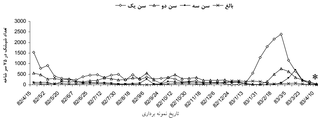
شکل ۱. تغییرات جمعیت مراحل مختلف سنی (به جز تخم) شپشک استرالیایی I. purchasi روی پرتقال سیاورز طی سال‌های ۸۳-۱۳۸۲ در شرف آباد دزفول