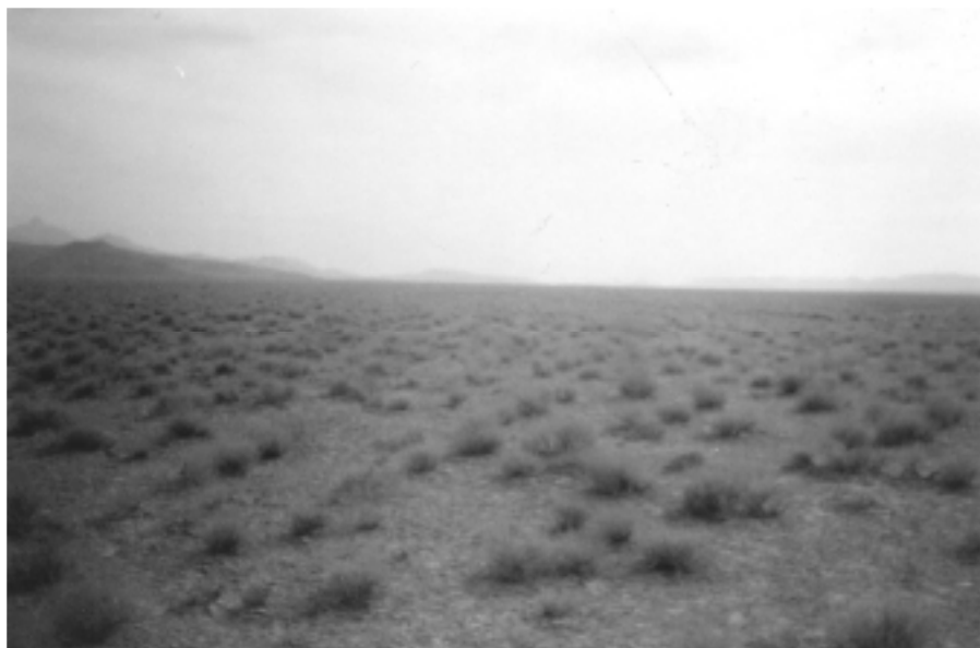
شکل ۴. منطقه صدرآباد ندوشن یزد

کوادراتی محاسبه شده در سطح احتمال ۵ درصد با استفاده از تست آماری مربوط به همان شاخص آزمون شد تا اختلاف هر یک از پراکنش تصادفی مشخص گردد (۱۰). برای مقایسه شاخص‌های الگوی پراکنش از نظر دقت، از طرح کاملاً تصادفی و جدول تجزیه واریانس استفاده شد، بدین ترتیب که واریانس بین ۱۲ عدد به دست آمده از هر شاخص در سه منطقه محاسبه و سپس (MSE) میانگین مربعات خطای آزمایشی و (SE) خطای استاندارد برای هر شاخص محاسبه گردید.