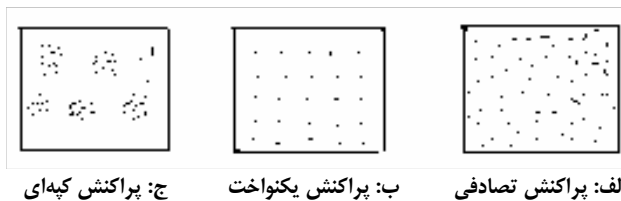
شکل ۱. سه نوع الگوی پراکنش گیاهان (اکولوژی آماری، لوودیک و رینولدز، ۱۹۷۵)

پوشش گیاهی این منطقه حدود ده درصد بوده به طوری که Artemisia sieberi با پوشش حدود ۹ درصد و تراکم آن در حدود ۰/۶۶ در متر مربع (۶۶۰۰ در هکتار) بوده و گونه‌های همراه آن Scariola orientalis , Salsola arbusculiformis با پوشش کمتر از یک درصد را شامل می‌شوند. تیپ گیاهی این منطقه Ar. Sa می‌باشد. این منطقه با وسعتی معادل ۸۱۰۵ هکتار بر روی دشت سرهای اپانداژ و لخت با حدود ارتفاعی ۱۹۶۰ تا