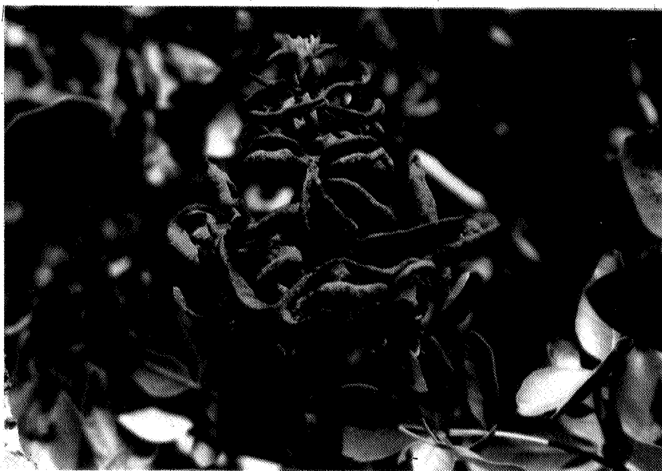
نگاره ۱. آلودگی سرشاخه‌های بنه به مرحله اوردیوم Pileolaria terebinthi