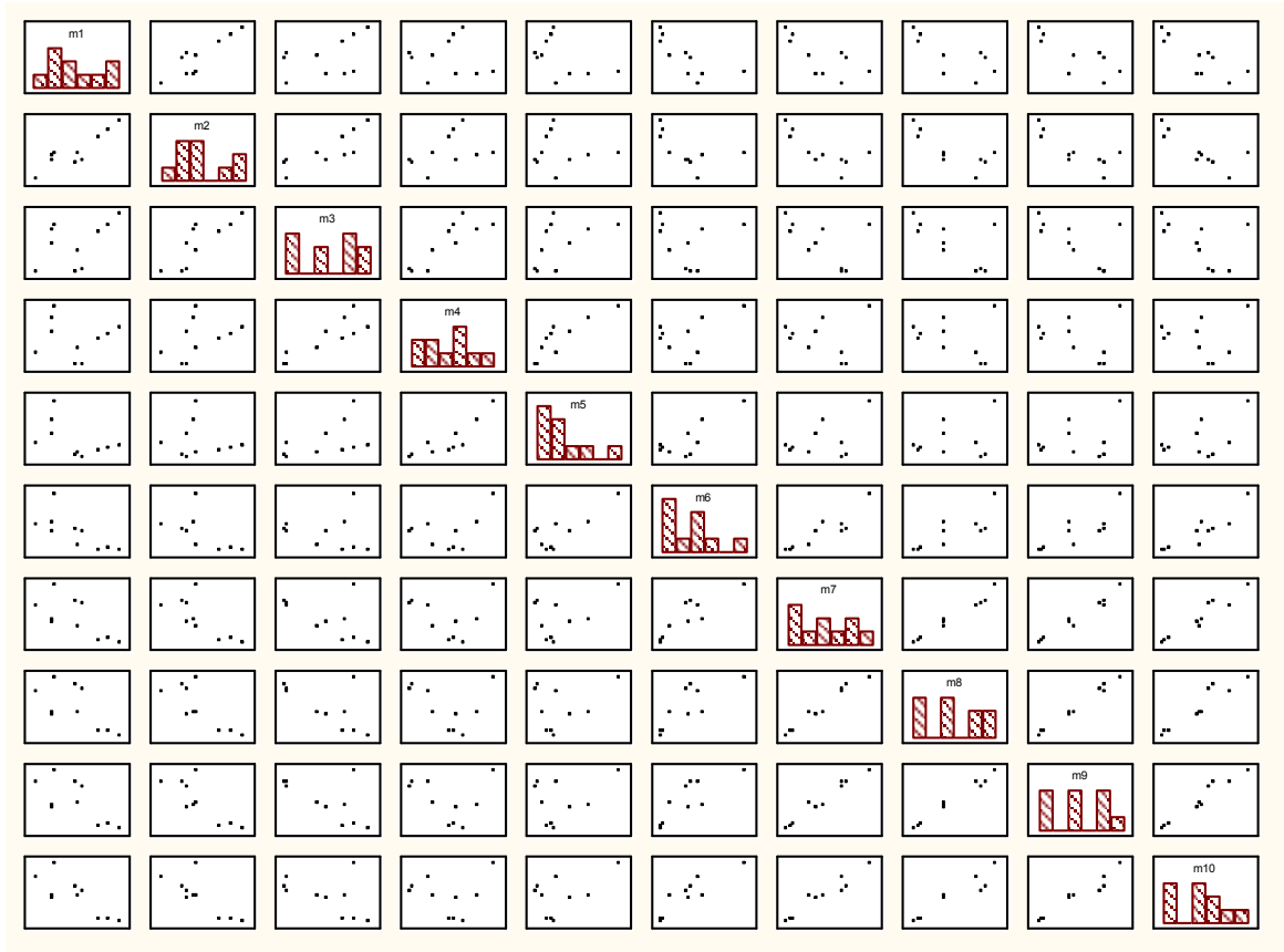
شکل ۲. ماتریس پراکنش ارزش اصلاحی پیش بینی شده شیر روزانه بین آزمون‌های ماهیانه (به ترتیب از سمت چپ به راست مستطیل‌ها مربوط به ماه‌های شیردهی ۱ تا ۱۰ می‌باشد).

دام‌های والد می‌تواند موجب کاهش فاصله بین دو نسل و در نتیجه افزایش میزان پیشرفت ژنتیکی گردد.