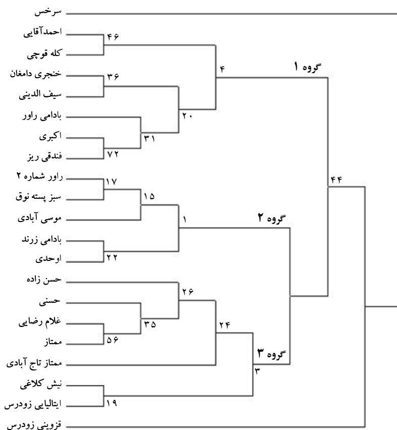
شکل ۳. گروه‌بندی ژنوتیپ‌های پسته ایرانی بر اساس الگوهای باندی SSR. با استفاده از ضریب تشابه نی (۱۹۸۳) و روش UPGMA. ضرایب هر Internal node مربوط به آزمون Bootstrap است.

تجاری پسته ایرانی را ناشی از دگرگشتن بودن پسته و عدم وجود یک سیستم دقیق شناسایی، نام‌گذاری و معرفی ارقام دانست که در حصول ضرایب نسبتاً پایین آزمون Bootstrap دخیل است. مقایسه دسته‌بندی مفروض با نشانگرهای SSR با گروه بندی به دست آمده از مطالعه RAPD روی ارقام مشابه (۵)، نشان از هم‌پستگی مطلوب نتایج حاصل از دو نشانگر داشت که این امر بیانگر آن است که دسته بندی‌های صورت گرفته چندان دور از واقعیت نیستند. اگرچه نشانگر RAPD نتوانسته بود ارقام غلامرضایی و ممتاز را از یکدیگر تفکیک کند، ولی نشانگرهای SSR استفاده شده در این مطالعه، ضمن تأیید تشابه قابل توجه این ژنوتیپ‌ها، توانستند این دو رقم را از یکدیگر تمییز دهند. چنین امری می‌تواند دلیلی بر کارایی بهتر نشانگرهای SSR به منظور انگشت‌نگاری ارقام و ژنوتیپ‌های پسته باشد.